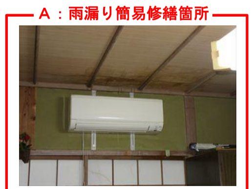
A : 雨漏り簡易修繕箇所