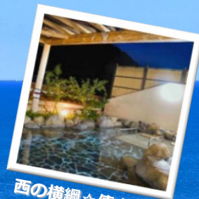
西の横綱☆依山温泉