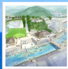
まちなみ整備が進む 長門湯本温泉見学