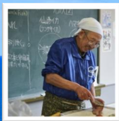
魚のさばき方体験